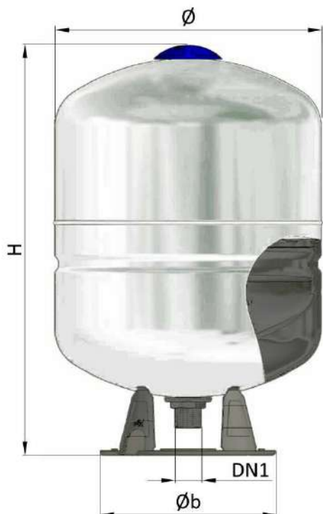
DPV-CE 50 – 500 litri

Multifunkcionāla tvertne ar fiksētu butila membrānu paredzēta uzstādīšanai gan kā izplešanās tvertne apkures un sanitārajās sistēmās, gan kā spiedtvertne aukstā ūdens sistēmās. Tā ir piemērota mainīgas temperatūras radītā ūdens izplešanās apjoma absorbēšanai. Abas pielietojanas jomas ir iespējamas, pateicoties tvertnes iekšējam butila aizsargslānim un īpaši izveidotam patentētām pievienošanas vītņiem mezglam, kuri nodrošina aizsardzību pret tvertnes iekšējās virsmas rūšēšanu.